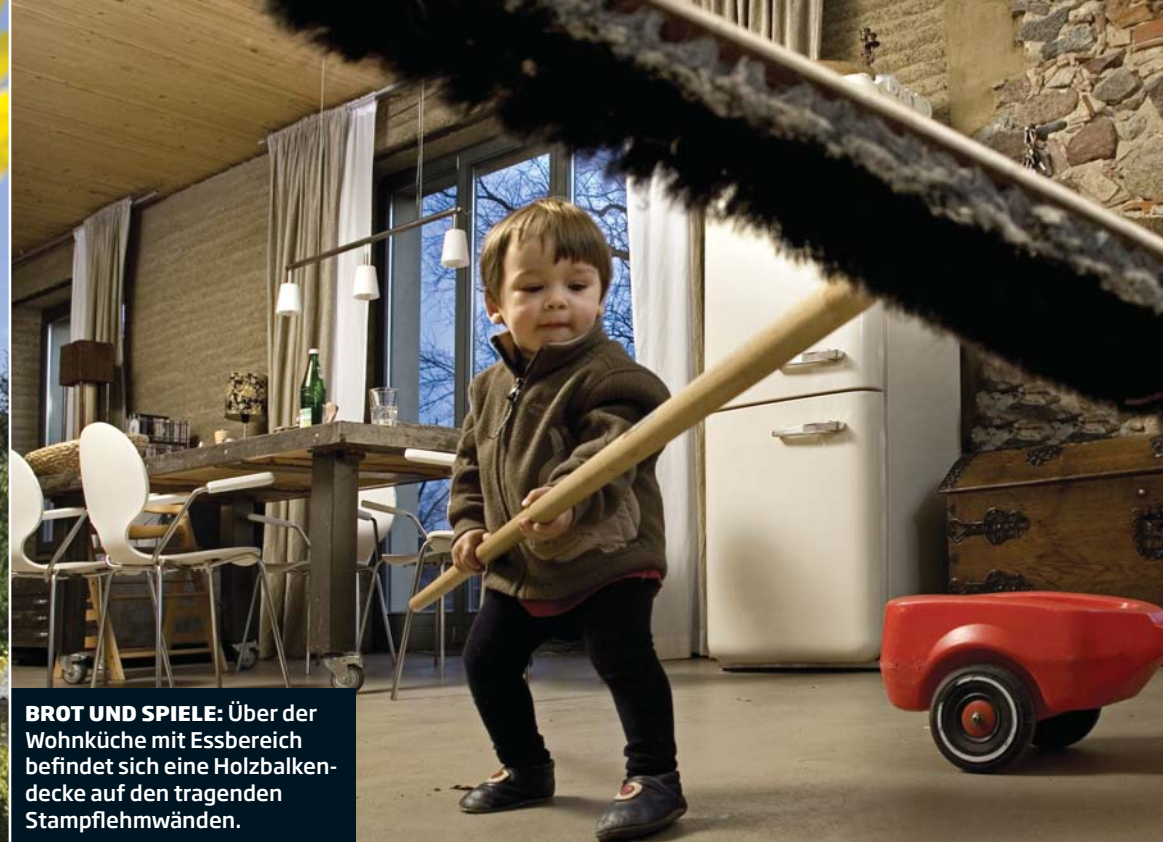
BROT UND SPIELE: Über der Wohnküche mit Essbereich befindet sich eine Holzbalkendecke auf den tragenden Stampflehmwänden.

Insgesamt wurden 65 Tonnen Stampflehm verbaut. „Diese Masse nimmt sehr schnell und sehr viel Feuchtigkeit auf“, erläutert uns Matthias Hein. „Wir haben ein sehr gut aus-